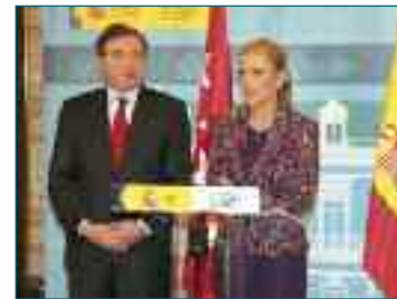
Ayuntamiento de Getafe

El lunes, 6 de febrero, el alcalde, Juan Soler, invitó a la delegada del Gobierno, Cristina Cifuentes, a presidir las Juntas Locales de Seguridad que se celebran en el municipio. La iniciativa tuvo lugar con el objetivo de mejorar la coordinación con el Gobierno de la nación en esta materia y aunar esfuerzos, y se llevó a cabo tras la reunión mantenida anteriormente con Cifuentes en la Delegación del Gobierno en Madrid. Juan Soler es el primer alcalde que se reúne con la nueva delegada y con ella trató diversos asuntos en torno al tema común de la seguridad del municipio, acerca del cual el alcalde afirmó que es una de las prioridades de su Gobierno. Dicho carácter prioritario se manifestaría en el esfuerzo que actualmente realiza para cubrir las vacantes de la Policía Local, o en el reciente anuncio de la constitución en el Cuerpo Local de la Escala Municipal con el