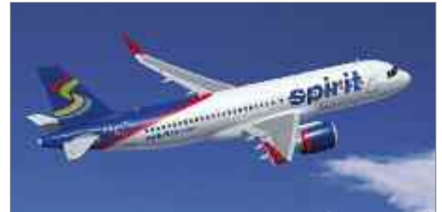
"Spirit tendrá una flota de aviones Airbus casi tres veces mayor a la actual cuando concluyan las entregas de este último pedido", señaló John Leahy

Spirit Airlines ha formalizado el pedido para la adquisición de 75 aviones de pasillo único que incluye 45 A320neo (new engine option – nueva opción de motor) tras el Acuerdo de Intenciones (MoU) firmado durante el Salón Aeronáutico de Dubai 2011. La aerolínea todavía no ha anunciado la elección del motor. Con la formalización de la compra de 45 A320neo en diciembre de 2011 y 30 A320 el pasado mes de enero, el número total de aviones encargados por Spirit asciende a 75 unidades.