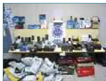
Material intervenido a los dos vigilantes de seguridad detenidos.