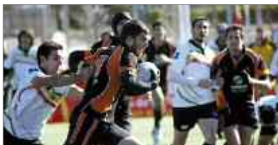
El equipo de rugby Airbus Aeronáuticos avanza imparable hacia la Copa de Madrid.

En resumen, una primera parte de vértigo, donde la delantera aeronáutica estuvo inmensa. Dominio absoluto de las fases de conquista. La melé: parecía deslizar sobre hielo pulido. La Touch; territorio vedado para el dragón. En el juego abierto, claro dominio de Hortaleza, de ritmo feroz a base de llamaradas.